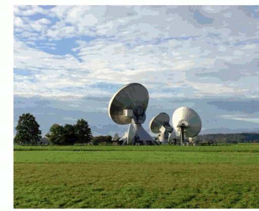
Компания РТКОММ представила торговую марку SenSat.